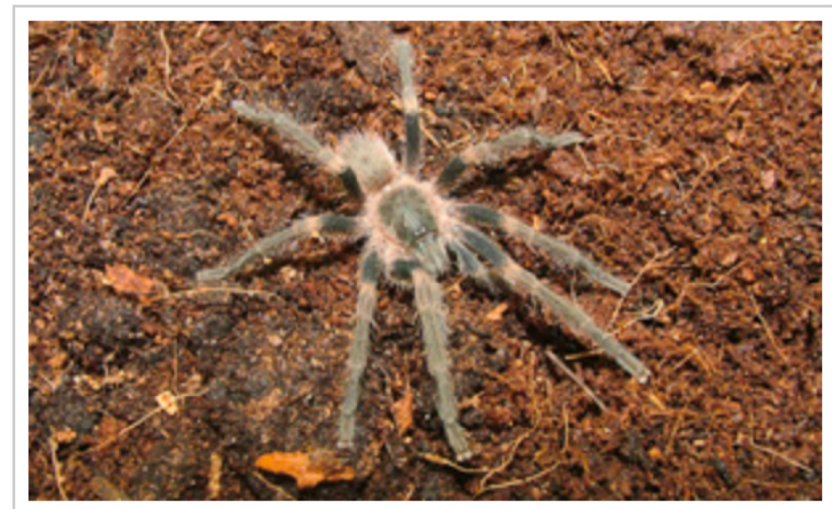
Macho Ami bladesi