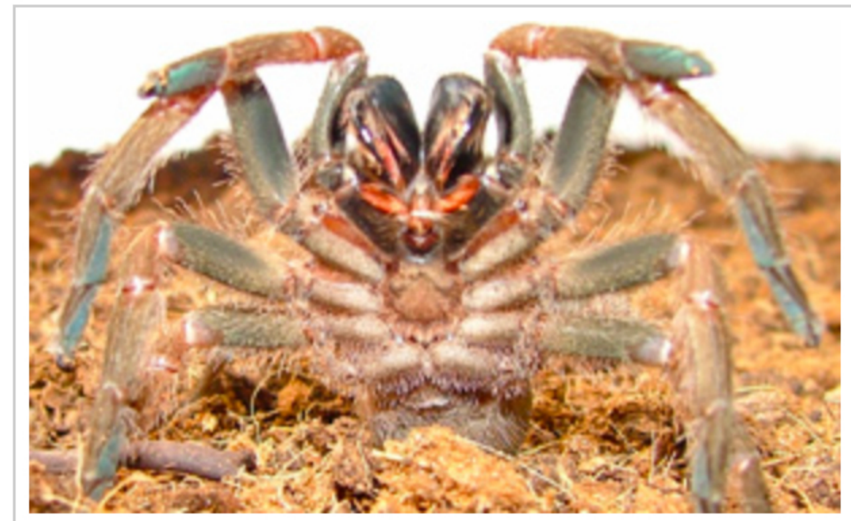
Hembra Ami bladesi en postura de amenaza

Peces, camarones, gusanos tubícolas, esponjas y otros parientes marinos de la desaparecida gran vía acuática entre los continentes quedaron para siempre forzados a vivir en el océano pacífico, un poco más fresco o en las cálidas aguas del Caribe—donde cada uno evolucionó de manera separada, convirtiéndose en especies similares las cuales no se pueden reproducir incluso si las ponemos juntas para ese fin. Como resultado, Panamá es uno de los pequeños países con más biodiversidad en el mundo.